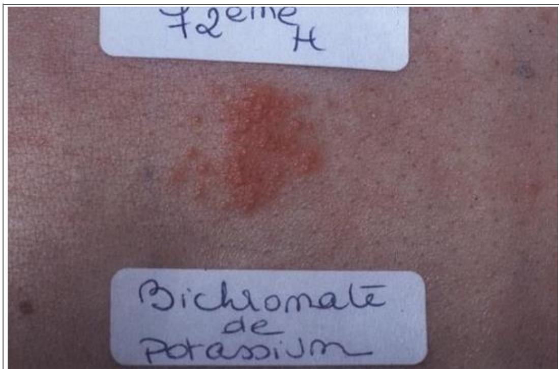
Test positif, à deux croix, avec le bichromate de potassium à la 72 ème heure