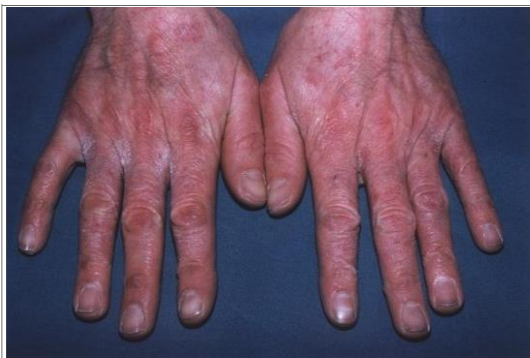
Eruption cutanée érythémateuse et desquamative des commissures interdigitales et des faces latérales de plusieurs doigts des mains

Tableau n° 51 ou n° 10 des maladies professionnelles du régime général.