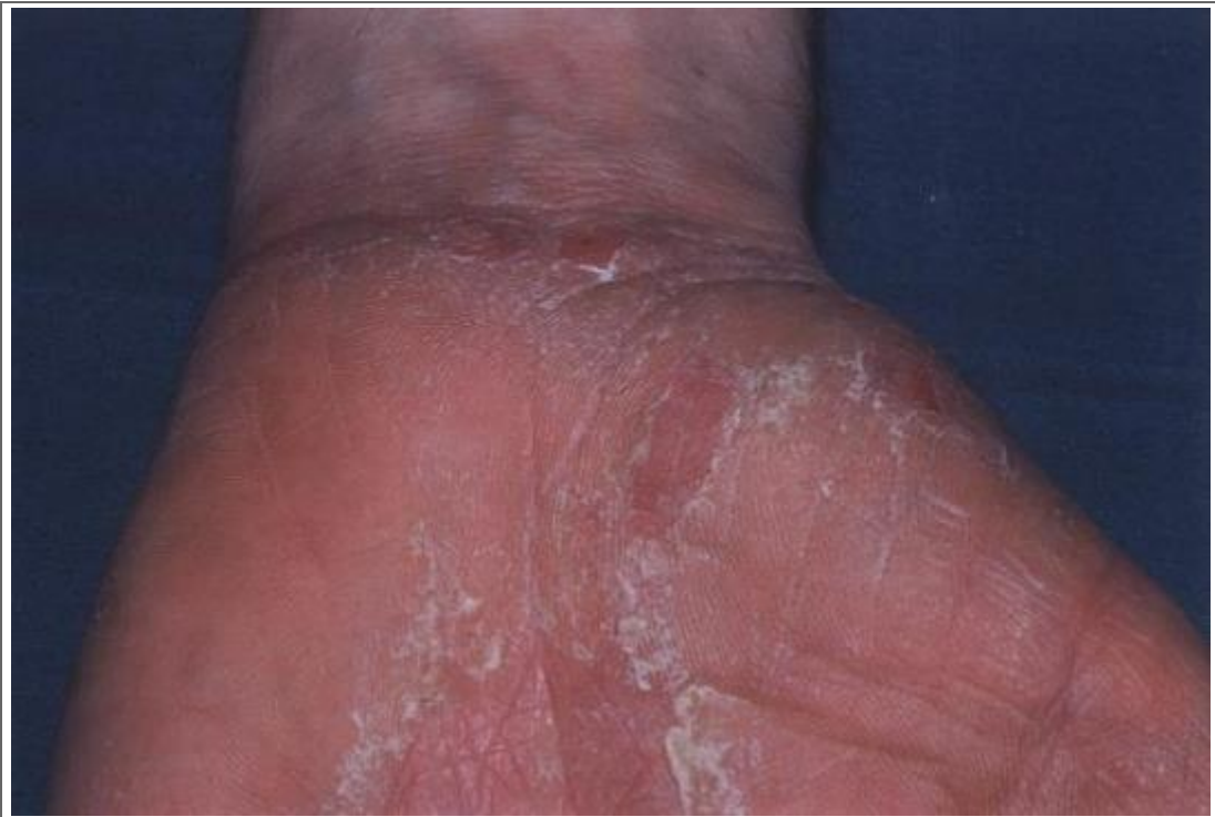
Lésions kératosiques et érythémato-squameuses de la face antérieure du poignet gauche et de la paume gauche