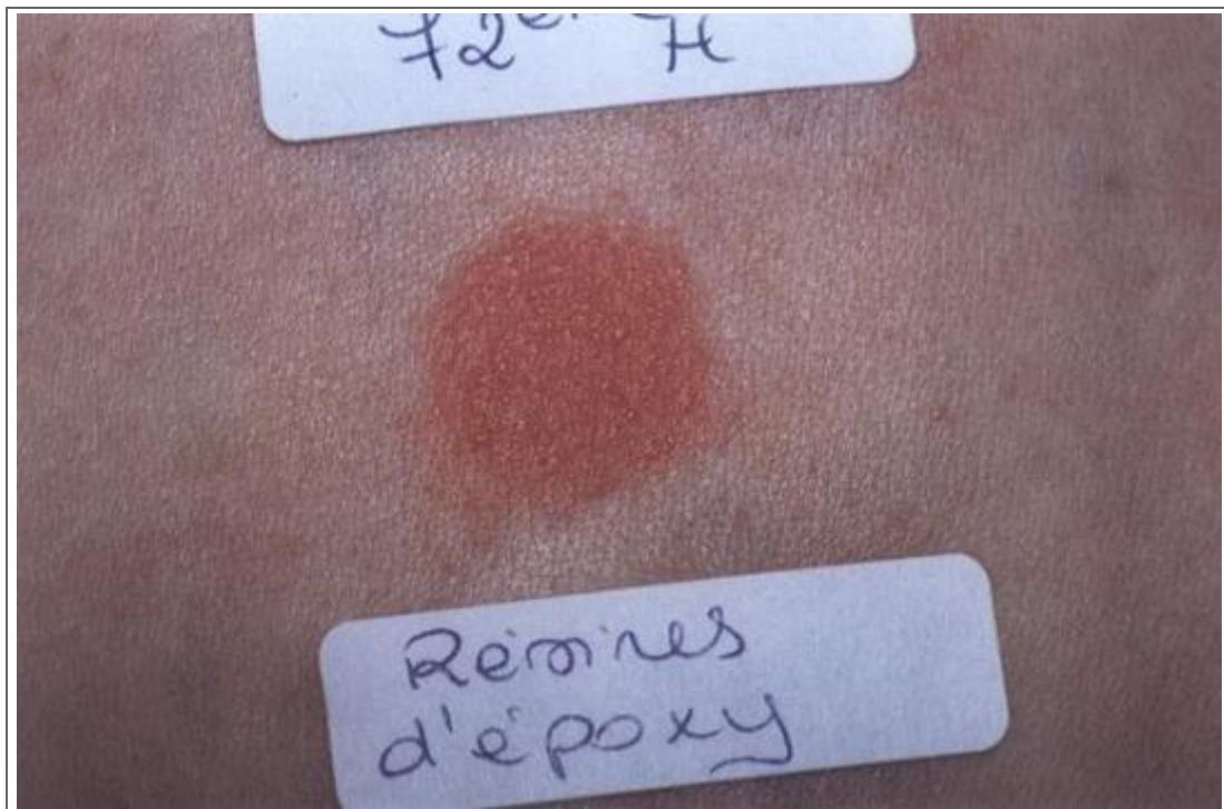
Test positif, à deux croix, avec les résines d'époxy à la 72 ème heure