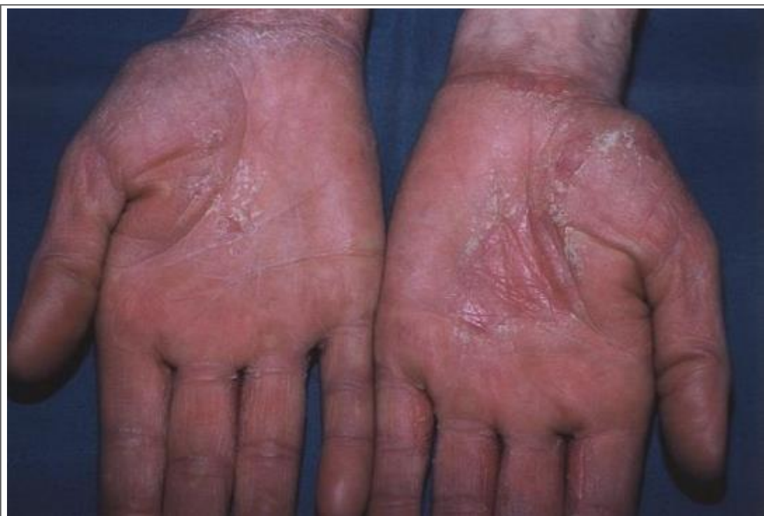
Kérotodermie circonscrite palmaire bilatérale, à prédominance gauche, chez ce droitier