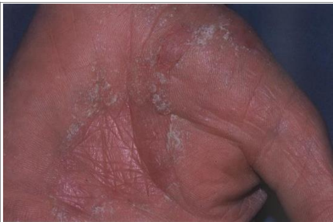
Atteintes kératosiques médio-palmaires gauches. (macro)